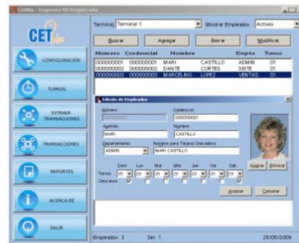
EDICIÓN DE EMPLEADOS