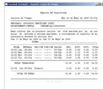
REPORTE DE TARJETA DE TIEMPO