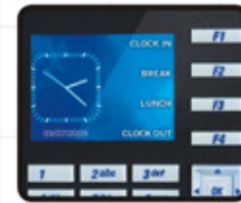
Hasta 16 comandos para Control de Asistencias